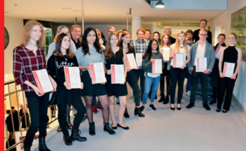
Kunstschüler der weiterführenden Schulen haben den Kunstkalender 2019 gestaltet. Alle Einreichungen wurden in einer Ausstellung am Sparkassenplatz gezeigt.