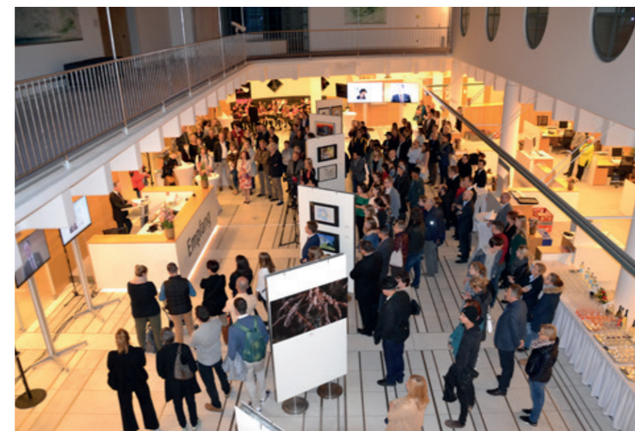
Ausstellung zum Kunstkalender 2019 in der Sparkassen-Hauptstelle