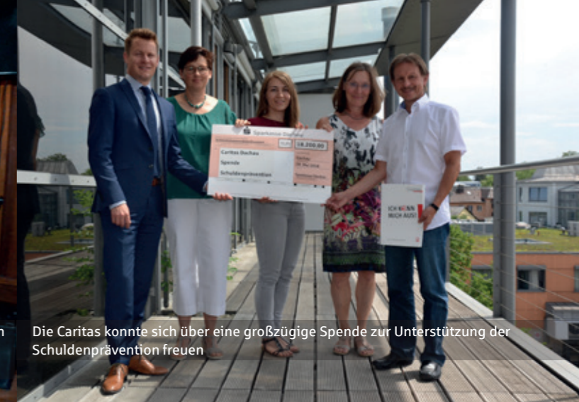
Die Caritas konnte sich über eine großzügige Spende zur Unterstützung der Schuldenprävention freuen