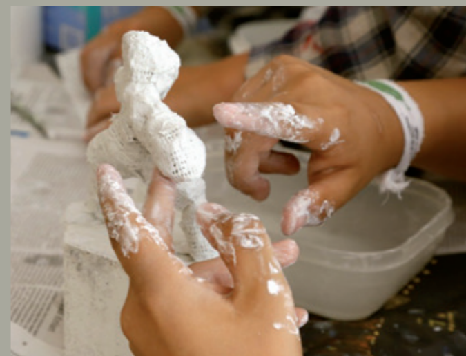
Unten: Cnopf’sche Kinderklinik in Nürnberg