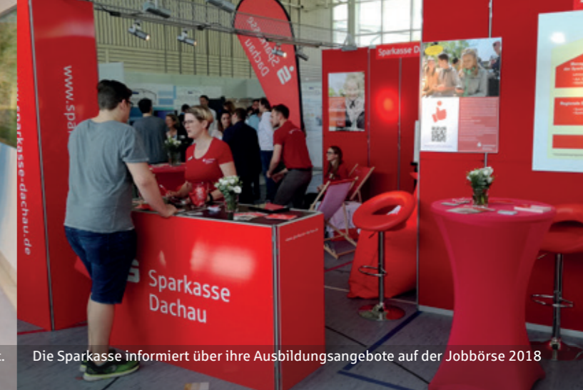
Die Sparkasse informiert über ihre Ausbildungsangebote auf der Jobbörse 2018