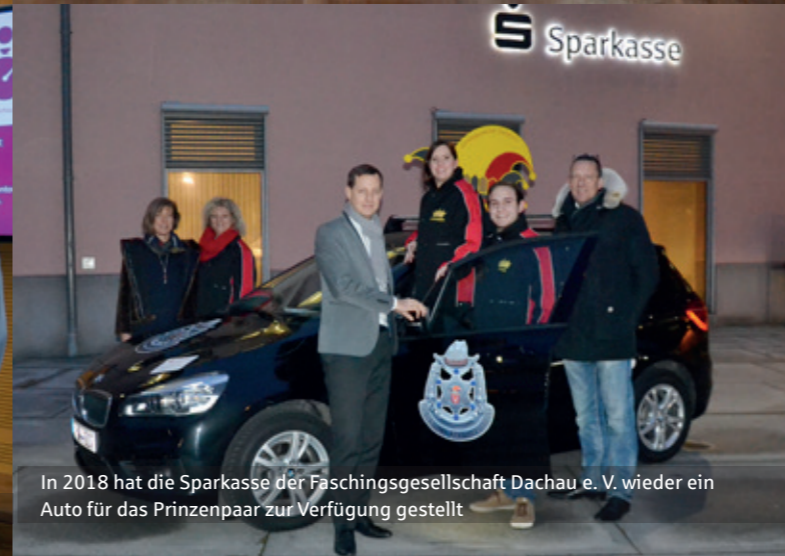
In 2018 hat die Sparkasse der Faschingsgesellschaft Dachau e. V. wieder ein Auto für das Prinzenpaar zur Verfügung gestellt