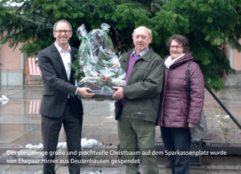
Der diesjährige große und prachtvolle Christbaum auf dem Sparkassenplatz wurde von Ehepaar Hirner aus Deutenhausen gespendet