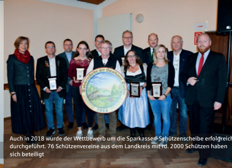
Auch in 2018 wurde der Wettbewerb um die Sparkassen-Schützen­scheibe erfolgreich durchgeführt. 76 Schützenvereine aus dem Landkreis mit rd. 2000 Schützen haben sich beteiligt