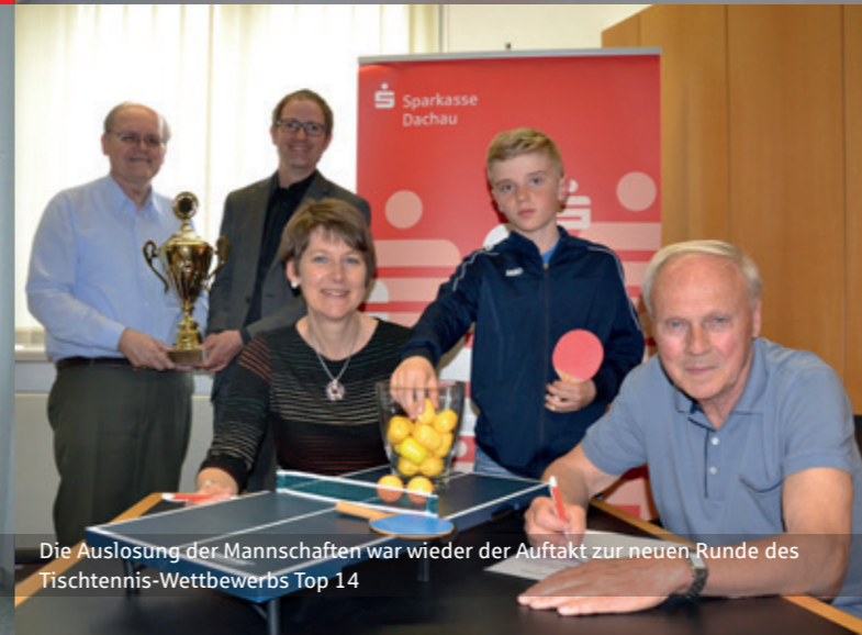
Die Auslosung der Mannschaften war wieder der Auftakt zur neuen Runde des Tischtennis-Wettbewerbs Top 14