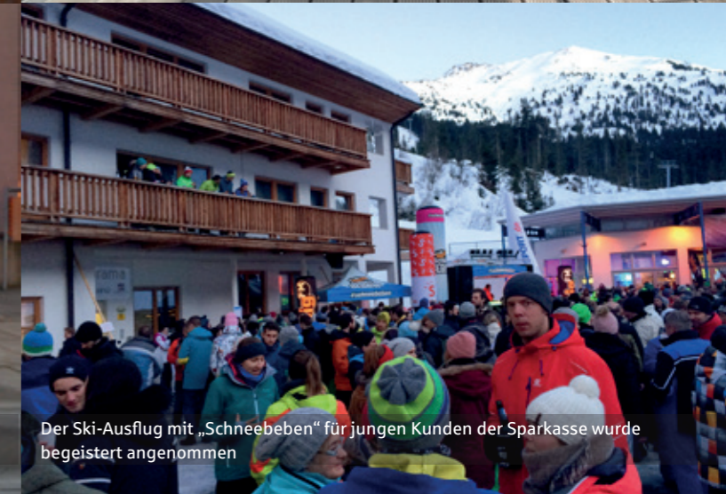
Der Ski-Ausflug mit „Schneebeben“ für jungen Kunden der Sparkasse wurde begeistert angenommen