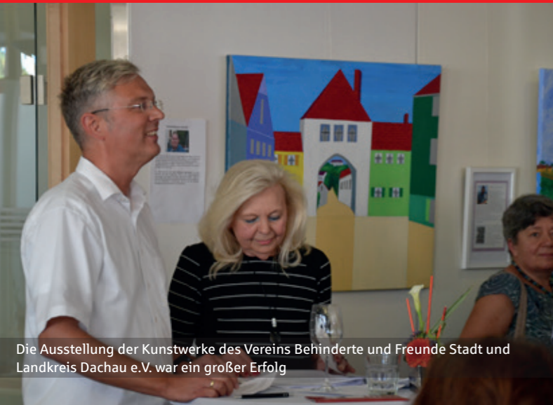
Die Ausstellung der Kunstwerke des Vereins Behinderte und Freunde Stadt und Landkreis Dachau e.V. war ein großer Erfolg