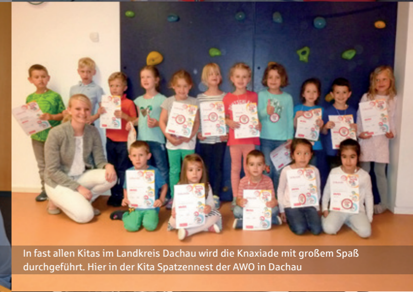
In fast allen Kitas im Landkreis Dachau wird die Knaxiade mit großem Spaß durchgeführt. Hier in der Kita Spatzennest der AWO in Dachau