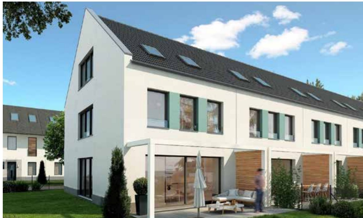
■ Neubau von Reihenhäusern in Markt Indersdorf

PPS: Es werden auch Eigentumswohnungen (eine ist noch verfügbar!) und Mietwohnungen angeboten. Sprechen Sie uns an, wenn Sie vermieten oder mieten möchten. Wir unterstützen Sie gerne.