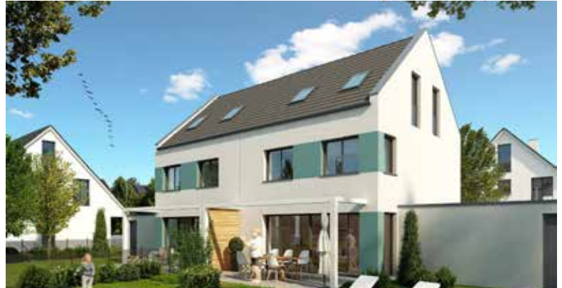
■ Neubau in Markt Indersdorf: Noch eine Doppelhaushälfte verfügbar

153 m 2 . Die Grundrisse sind klar definiert und die Räume lichtdurchflutet. Hier kann die Sonne ins Haus! Sämtliche Bäder sind großzügig und attraktiv gestaltet. Jedes Haus ist unterkellert (59 m 2 ) und hat einen großen Carport mit zwei Stellplätzen. Der Kaufpreis liegt bei 990.000 Euro. Die Reihenhäuser haben Grundstücksgrößen zwischen 274 und 322 m 2 – sowie Wohnflächen zwischen 146 und 149 m 2 . Auch sie sind unterkellert und mit einem Carport ausgestattet. Der Preisrahmen liegt zwischen 845.000 und 935.000 Euro, ohne zusätzliche Maklercourtage. PS: Wir können bei diesem Objekt Extra-Zins-Konditionen bieten.